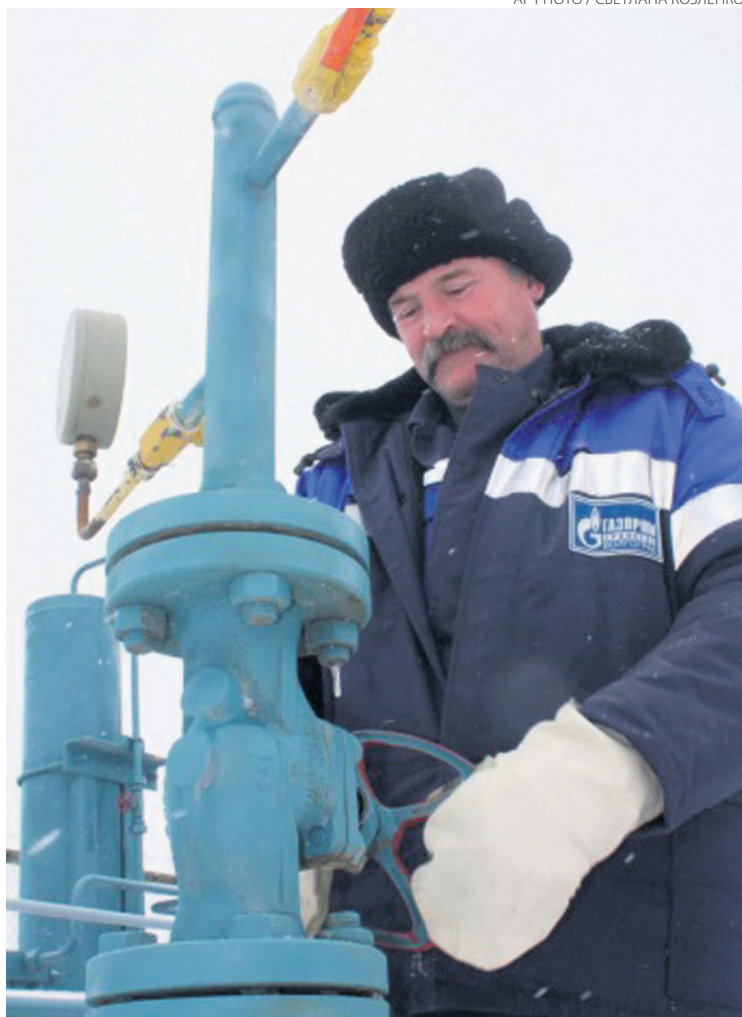
Эксперты полагают, что проблемы Украины с оплатой за потребленный российский газ обострятся